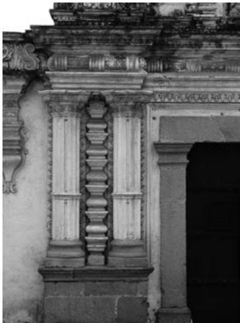
Figura 17: Detalle portada barroca en la que se aprecia la transformación de los elementos tradicionales que componen un orden arquitectónico. Las columnas no son más de sección circular, sino poli lobulada, el entablamento dejó de ser un elemento plano y se transforma en curvo, al igual que las metopas y triglifos que lo integran. Aparece entre las columnas, una pilastra llamada almohadillada, así como una profusa decoración que cubre todas las superficies.