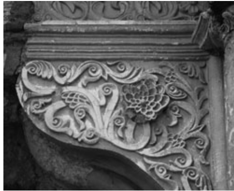
Figura 22: Detalle arranque del arco sobre la puerta principal en el que se aprecia la rica decoración vegetal, así como el moldurado intradós.

Con el Plan Regulador de 1967, el futuro de La Antigua Guatemala está previsto. Su conservación quedó garantizada por la Ley Protectora de 1969 que definió un polígono dentro del cual que-