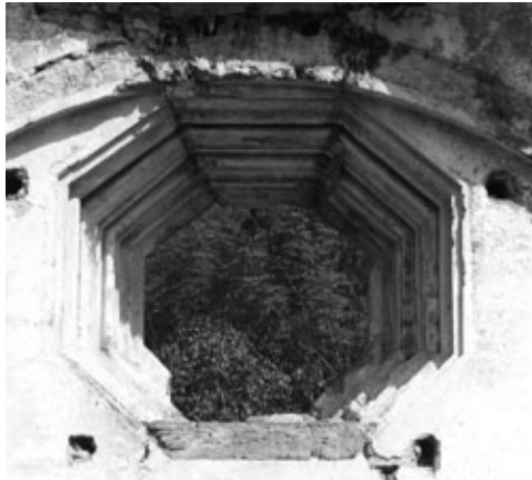
Figura 16: Ventana octogonal en el interior de la Recolectación, cuyos derrames están trabajados con molduras, como si se tratara de un trabajo de carpintería.

En la fachada, de más de dos metros de espesor, el juego de pares de columnas colocadas en distintos planos resuelve el problema estructural ante el embate de los sismos, al tiempo que ofrece, debido a su composición, una solución visualmente etérea gracias al juego de luz y sombra que se genera entre ellas. Así mismo, la decoración geométrico-vegetal aplicada a sus fustes crea un aligeramiento visual mediante la textura de tosca filigrana que produce la sensación de que las columnas pierden la pesantez que les permite