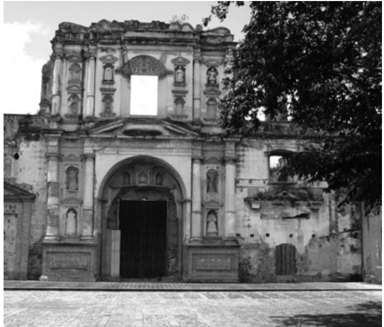
Figura 10: Fachada Compañía de Jesús (1698), arquitecto Joseph de Porres. Nótese el orden gigante de las columnas adosadas del primer cuerpo, el frontón triangular abierto sobre la puerta principal y los entablamentos apenas delineados por sutiles molduras.

Como quedó dicho, fueron las reparaciones, reconstrucciones y ampliaciones, la transformación de algunos elementos arquitectónicos y la obra nueva que siguió a los terremotos, lo que determinó los cambios en la arquitectura de la ciudad. Puede considerarse que el terremoto de 1715 fue el hecho que marcó el final de ese período de transición y que, tímidamente, dio paso al Barroco. La etapa de crecimiento y desarrollo