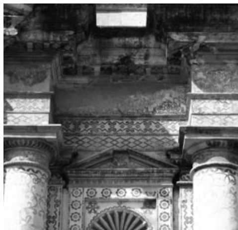
Figura 12: Detalle fachada Compañía de Jesús en la que se utilizó la pintura mural, aplicada "al fresco", con diseños geométricos y vegetales, que lo convirtió en el más rico de la ciudad.