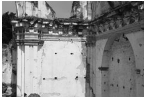
Figura 23: Cornisa en nave del templo formada por varios elementos, entre los que hay ménsulas, pilastrillas y molduras que recuerdan las cortinas. Con su movimiento ondulante y junto a las molduras que bajan de las bóvedas, dieron al espacio interior el carácter envolvente, propio de la arquitectura barroca.