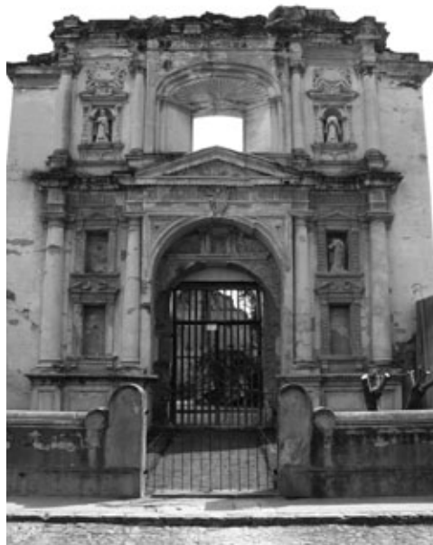
Figura 11: Fachada Santa Teresa (1687), arquitecto Joseph de Porres, al igual que en la Compañía de Jesús, destaca la puerta principal con una portada que sobresale hasta el rostro exterior de las columnas adosadas, haciendo que el entablamento también sufra ese desplazamiento hacia el frente.