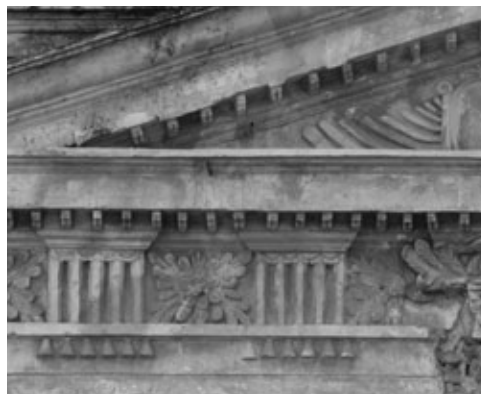
Figura 6: Detalle entablamento de la fachada de santa Teresa (1687) arquitecto Joseph de Porres. Triglifos de cinco barras, en un intento por expresarse con un lenguaje arquitectónico distinto.