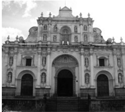
Figura 5: Fachada Catedral (1680), arquitecto Joseph de Porres. Destaca el orden gigante de las columnas adosadas que definen el primer cuerpo, la transformación de los triglifos de tres a seis barras y la introducción de otros elementos decorativos, como el escudo papal y la concha que identifica al Apóstol Santiago.