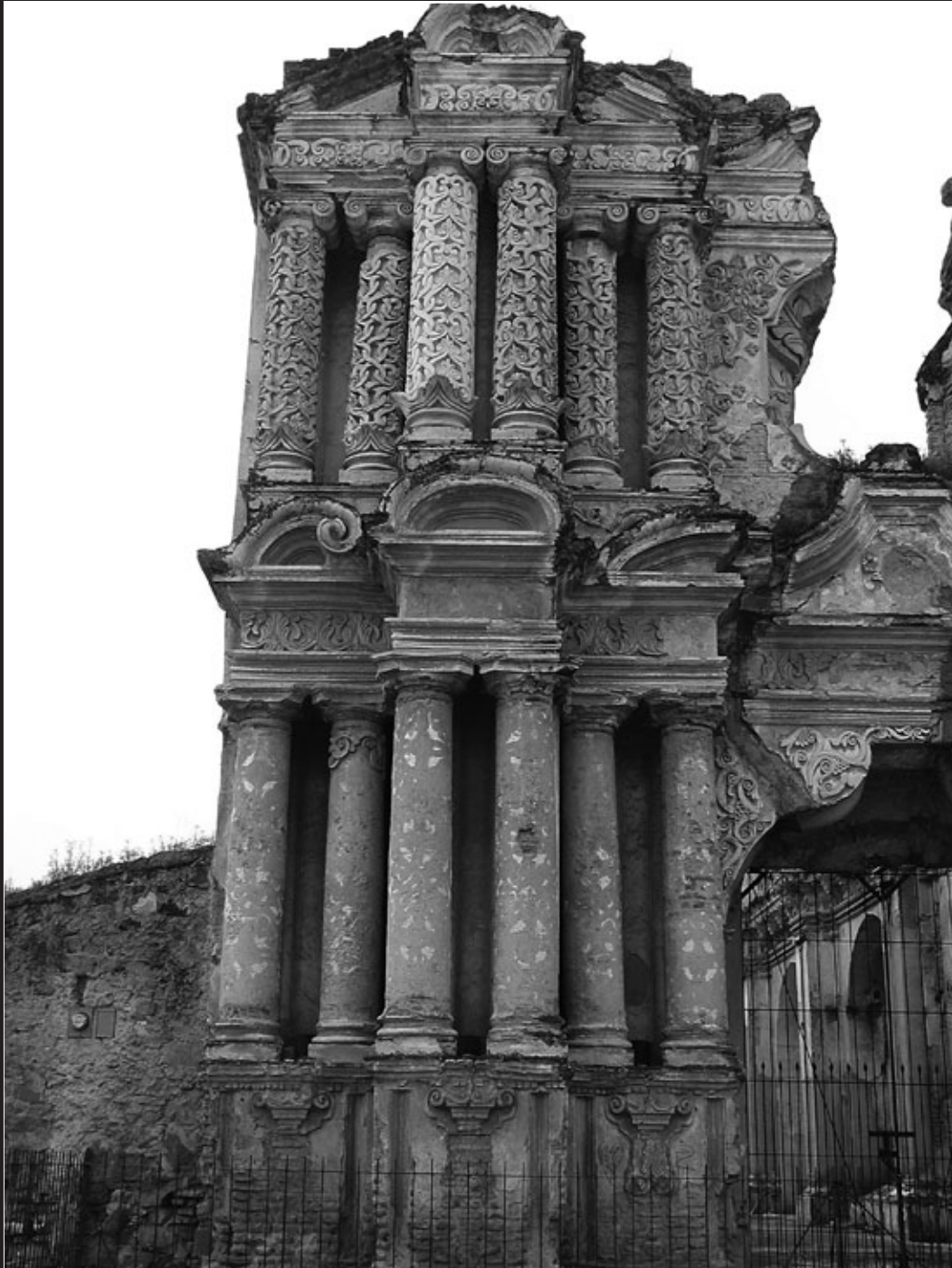
Fachada del Carmen