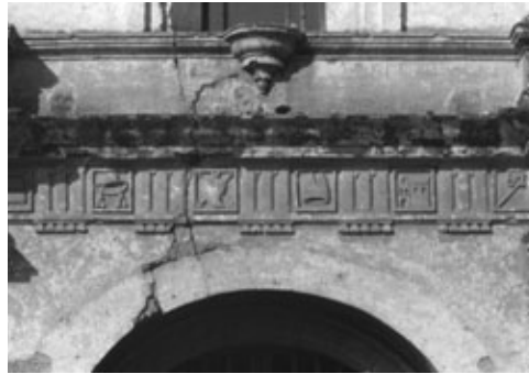
Figura 4: Detalle fachada templo de san Agustín, 1657, arquitecto Juan Pascual. Sin duda el mejor ejemplo de arquitectura renacentista, en el que destaca el respeto por los órdenes arquitectónicos y la delicadeza de las metopas del entablamento entre el primero y segundo cuerpo.

A lo largo de ese periodo, las distintas corrientes culturales llegadas de ultramar fueron conocidas gracias al comercio que sin duda trajo consigo publicaciones y noticias de lo que acontecía en la península ibérica y, por su medio, en Europa, así como por los viajeros que llegaron a estas remotas tierras. Los primeros edificios probablemente fueron inspiración de los mismos curas, autoridades y vecinos, quienes debieron levantar los templos y casas de bahareque y