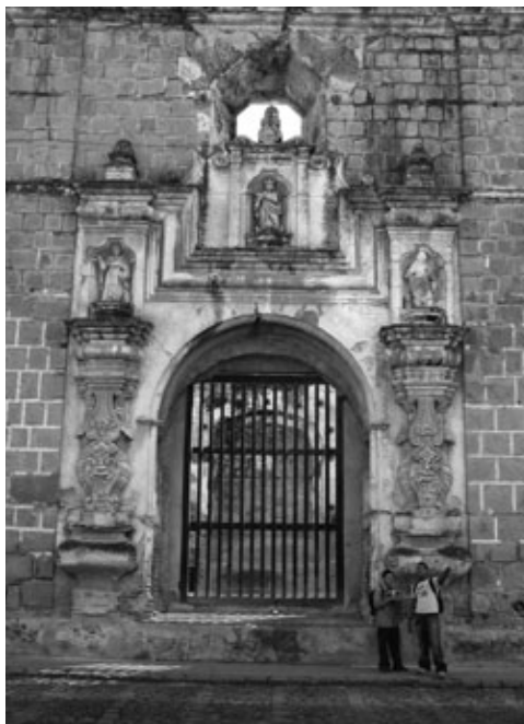
Figura 18: Detalle portada lateral Santa Clara (1734), de Diego de Porres. Dentro de la sobriedad de la fachada de piedra, destaca la portada trabajada en estuco y dentro de esta, las pilastras abalaustradas serlianas que dan apoyo a hornacinas con dintel poli lobulado. Nótese la magnífica composición del entablamento curvo sobre las hornacinas que baja para dar lugar a la hornacina central y salvar la ventana octogonal, sobre el eje central.