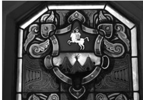
Figura 1: Escudo de la ciudad otorgado por el Emperador Carlos V, el 28 de julio de 1532, con Santiago Apóstol a caballo sobre tres volcanes, el de en medio en erupción.

Desde el punto de vista urbano, el modelo, que si bien es cierto no se trata de un patrón para seguir, fue el resultado de coincidencias que más adelante fueron recopiladas en las Ordenanzas aludidas. Las ciudades fueron trazadas a regla y cordel siguiendo un trazo geométrico en el que las calles se cruzan formando una retícula, muchas veces orientadas según los puntos cardinales. Prevalcieron tres tipos: la retícula, en la que los trazos se cruzan de manera irregular; la retícula regular, en la que los trazos se interceptan en ángulos rectos, y la cuadrícula, en la que los trazos se