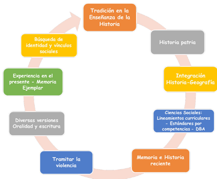
Ilustración 1. Problematización discursiva de la enseñanza de la historia y la memoria.