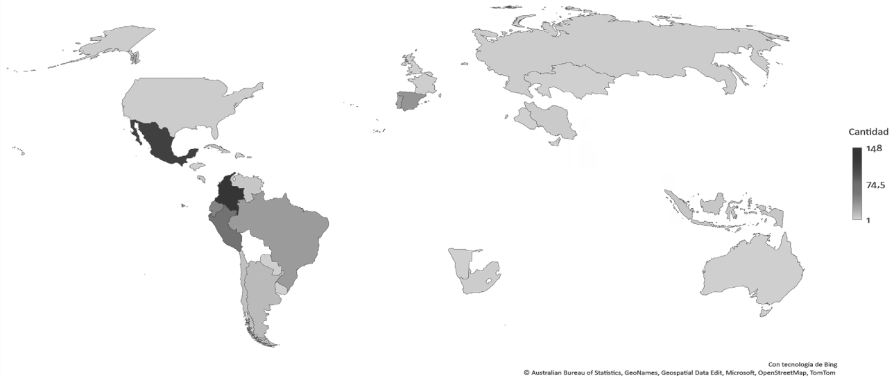
Figura 1. Origen geográfico de los autores de Innovar .

la Facultad de Ciencias Económicas de la Universidad Nacional de Colombia y de su EACP.