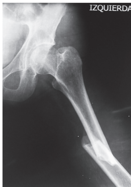
Figura 1. Rayos X que evidencian una fractura diafisaria de fémur izquierdo, oblicua, angulada y desplazada.

Los bisfosfonatos son el manejo de primera línea en paciente con diagnóstico confirmado de