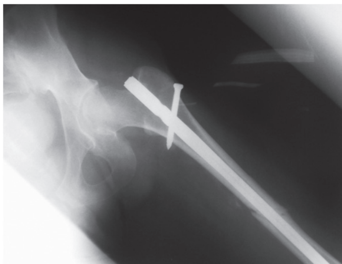
Figura 3. Radiografía de control a los 3 meses posquirúrgico.

oscilan entre tres y ocho años, incluso en reportes de pacientes en tratamiento hasta por 10 años, en los que la biopsia de hueso muestra una severa supresión de los osteoclastos 8-10 . llevando a una acumulación progresiva de microlesiones. Los bisfosfonatos también alteran el metabolismo de la matriz de colágeno disminuyendo la dureza del hueso, esto se ve contrarrestado por el aumento de la mineralización y de la masa ósea incrementando la rigidez y la resistencia 11 . Todos estos eventos, finalmente, alteran las propiedades mecánicas del hueso, además hay una fracción