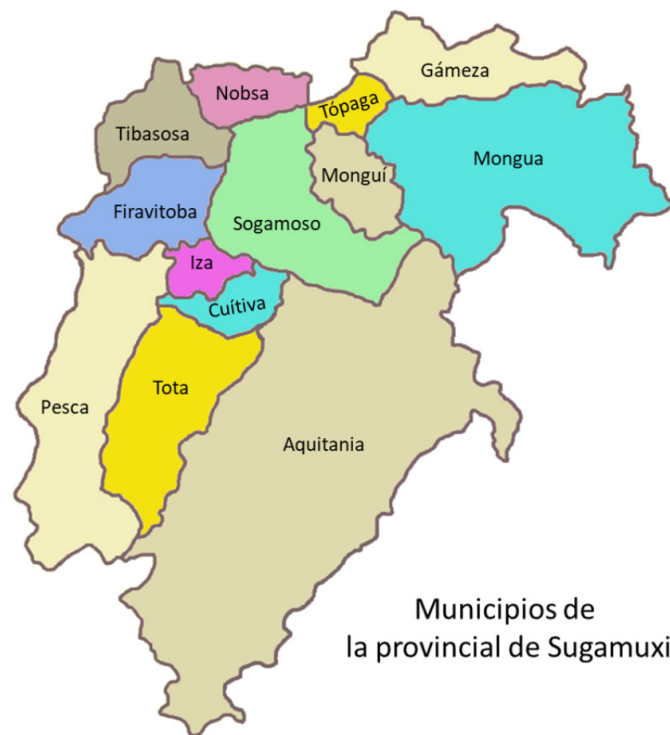
Figura 2. Municipios de la provincia de Sugamuxi